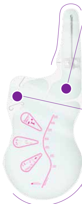
Actreen® Mini Set