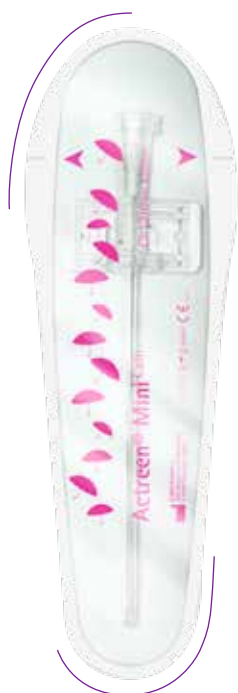
Actreen® Mini Cath

Unsere Actreen® Minis schenken Ihnen die Freiheit, sich auf die wirklich schönen Dinge des Lebens zu konzentrieren. Ganz gleich, wonach Ihnen gerade der Kopf steht. Dank des Mini-Formats finden Actreen® Mini Cath & Actreen® Mini Set in jeder Tasche einen Platz – so werden unsere „Minis“ zum unsichtbaren, hilfsbereiten Begleiter und sind immer bereit, wenn Sie es sind.